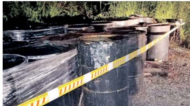
Sebanyak 112 tong berisi minyak bitumen itu dijumpai diletakkan di tepi jalan berhampiran pembentungan sungai di Kampung Sungai Jang, Kerling.

Beliau turut memberitahu, siasatan lanjut turut mendapati tong-tong ter-