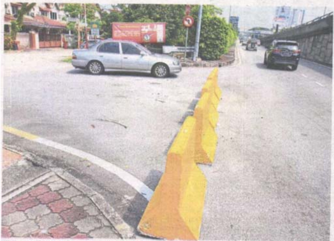
Under the new scheme, Jalan SS7/3 (left) can only be used to exit onto the LDP, as the entrance from the highway is blocked.