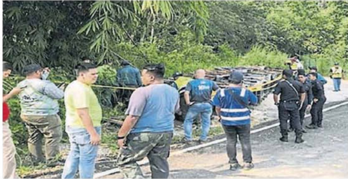
■在发现装有不明液体的桶之后，各单位也针对该批桶的来历展开调查。