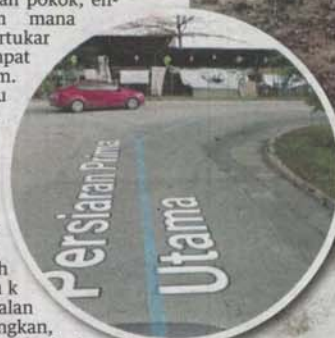
PENTERNAKAN ayam berdekatan dengan tasik Puchong Prima, Selangor yang menimbulkan rasa tidak selesa dalam kalangan penduduk.

bandaran Subang Jaya (MPSJ) kira-kira dua minggu lalu namun masih tiada tindakan diambil oleh pihak berkuasa