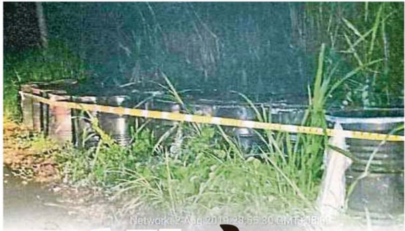
Network 2-AUG-2019 12:35:30 GMT+0800