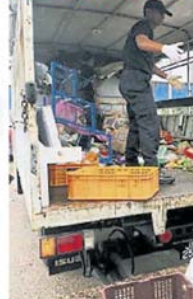
每逢取締外勞小販，雪州各地方府儀能將物品充公。(檔案照)

雪州行政議員黃思漢日前向《中國報》記者指出，非法外勞小販問題主要有兩種情況，一是外勞小販當老板，及本地小販非法轉租攤位給外勞，他們同時帶來許多問題。