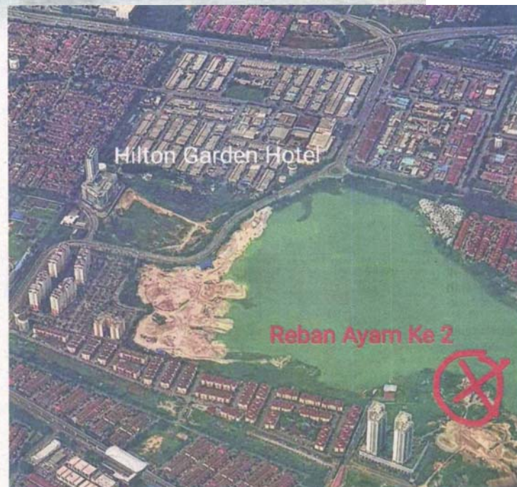
LOKASI reban ayam berdekatan Tasik Puchong Prima yang menyebabkan pencemaran bau.