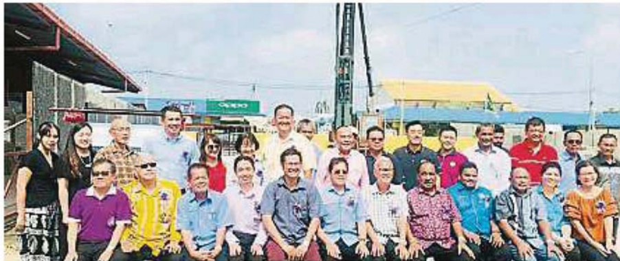
← 沙白南华小学讲堂举行开工仪式后，全体嘉宾，校长及三机构代表合照。