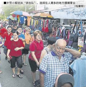
外勞小販如“游击队”，选择在人潮多的地方擺攤營業。(檔案照)

也有市議員指出，除了外勞小販，本地小販也一樣帶來垃圾堆積的問題，因此不能將矛頭指向外勞。