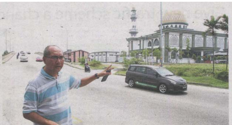
Husin says during peak hours, traffic slows down at the intersection of Jalan Balung Ayam and Jalan Sungai Bertih, contributing to a 430m backlog of vehicles until Masjid Nurul Iman, along Jalan Sungai Bertih.

"Since the Raja Muda Nala Bridge was opened, it causes a traf-