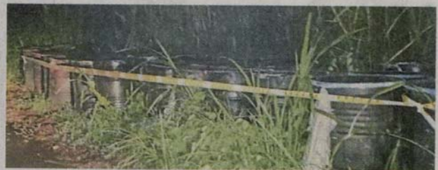
■乌雪吉磷双溪江原住民村发现112个装有液体的桶, 被丢弃在河流附近。