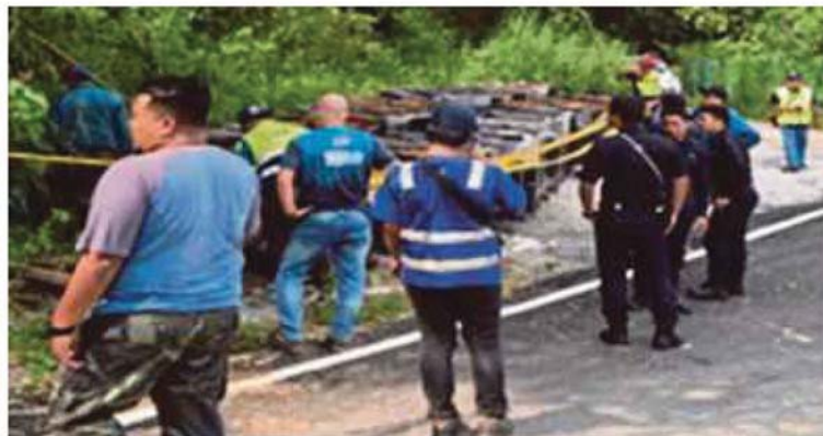
Pihak LUAS memasang pita sekatan di lokasi 112 tong berisi cecair mudah terbakar ditemui berhampiran anak sungai di kampung Orang Asli Sungai Jang, Kerling, Hulu Selangor, semalam.

Oleh Khairul Azran Hussin dan Md Fuzi Abd Lateh bhnews@bh.com.my