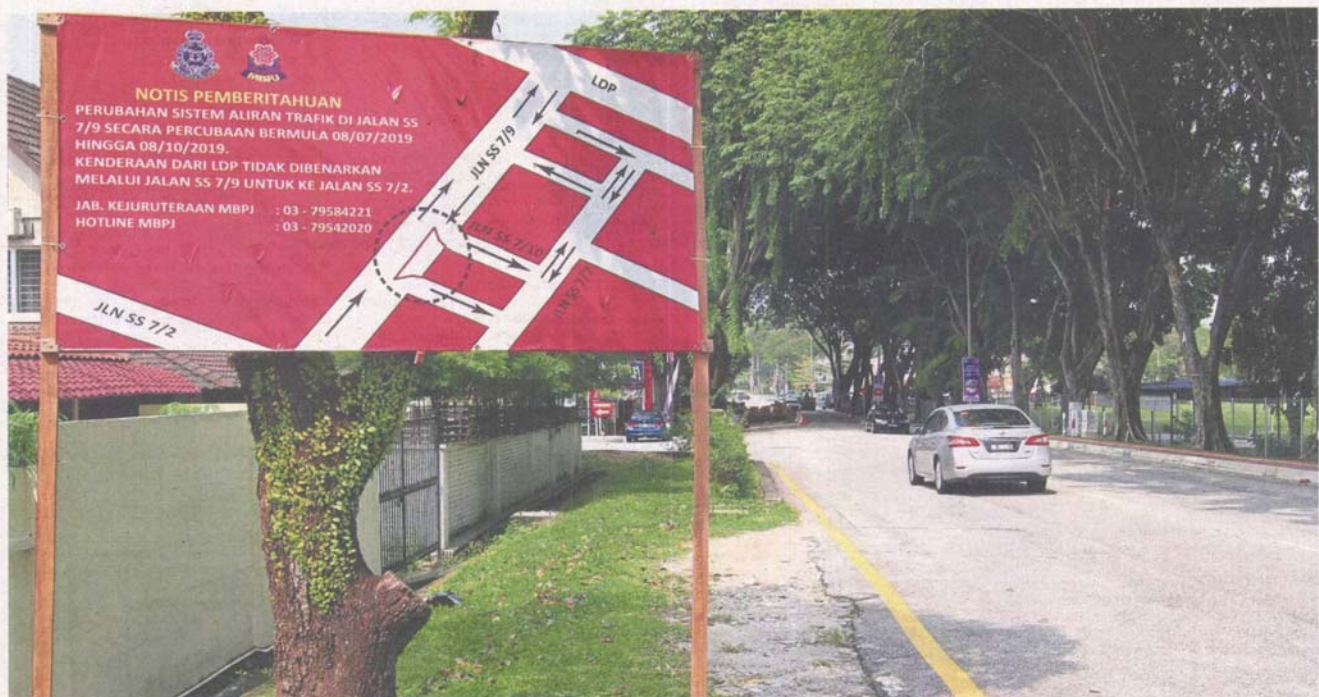
New traffic scheme: Signboards have been placed at the affected stretches to alert residents and motorists of the traffic changes at Jalan SS7/9, Jalan SS7/10 and Jalan SS7/3 in the SS7 Lengkok Golf neighbourhood.

Some residents in SS7 Petaling Jaya are against a traffic scheme introduced on a trial basis by MBPJ last month, saying it is chaotic and contributing to near misses and collisions in the neighbourhood. >2&3