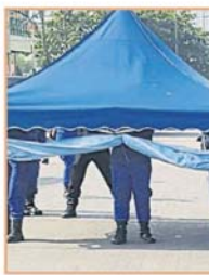
執照人員將外勞小販的執照拆掉。(檔案照)

他指出，為了有效監管非法小販，雪州政府目前已在初步擬定新條例，尤其在避免小販執照被濫用這方面，以設下明確的標準作業程序(SOP)給各地方政府的執照。