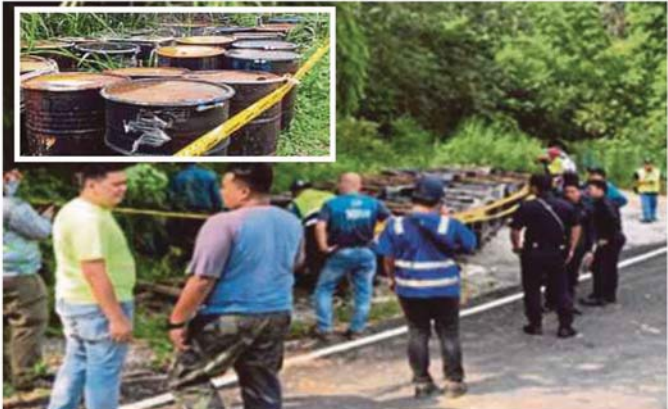
SEBANYAK 112 tong berisi cecair ditemui berhampiran sungai di perkampungan Orang Asli di Sungai Jang.

Menurutnya, sehingga kelmarin semua tong dihantar ke kilang itu namun Luas dan agensi berkaitan terus memantau lokasi berkenaan.