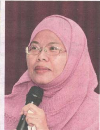
The traffic scheme is meant to benefit residents as it takes into account new project developments and future traffic projection, says Rahibah.