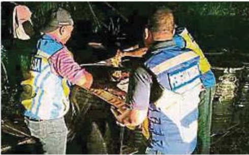
↑工作人员收集样本做化验。