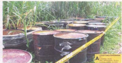
TONG disyaki berisi minyak bitumen ditemui di anak sungai berdekatan perkampungan Orang Asli Sungai Jang, Kerling, Hulu Selangor pada Sabtu lalu.

“Selain itu, JAS turut telah mengarahkan pemilik kilang berkenaan untuk menguruskan kesemua tong itu dengan menjauhkannya dari sungai seperti yang tertakluk di bawah Akta