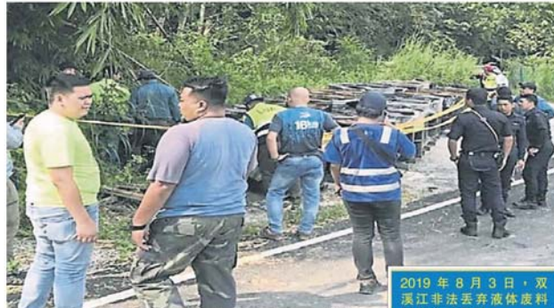
多个单位执法人员联合展开调查工作, 现场发现 112 个装有不明液体的铁桶。