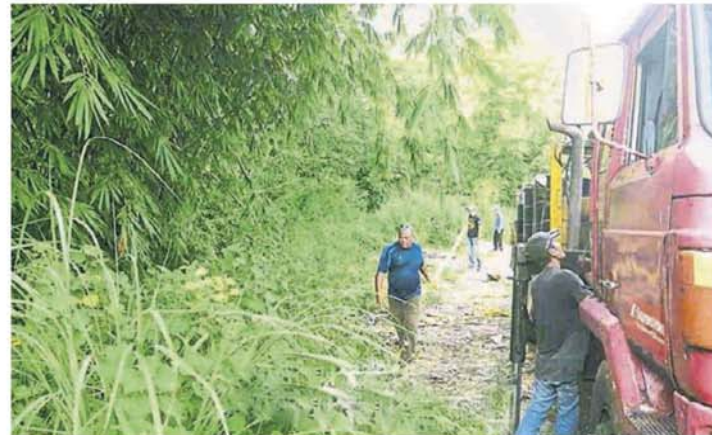
■丢弃在支流旁的桶已被清理。

他说，截至本月4日，早前丢弃在支流旁的桶已全运回该工厂，雪州水务管理机构迄今仍在事发地点进行监督。