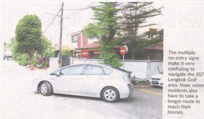
The multiple no-entry signs make it very confusing to navigate the SS7 Lengkok Golf area. Now, some residents also have to take a longer route to reach their houses.

"The petition covers four aspects – objection to a new traffic scheme for the overall SS7 area done by the RA's consultant, objection to the road diversion by the action group, requesting MBPJ to remove the concrete barriers, as well as replacing Rahibah for her inaction and failure to perform her duty to protect the interests of SS7 residents."