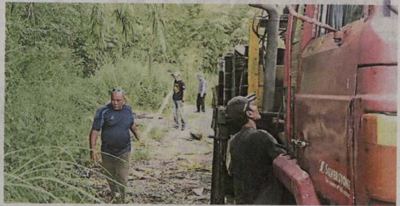
■雪州水务管理局接获投报后, 马上采取行动。

(八打灵再也5日讯) 雪州水务管理局(LUAS)接获乌雪县议会投报, 指乌雪吉磷双溪江原住民村发现不负责任园主, 将112个装有液体的桶丢弃在河流附近, 经过调查后, 庆幸没有任何液体流入河内。