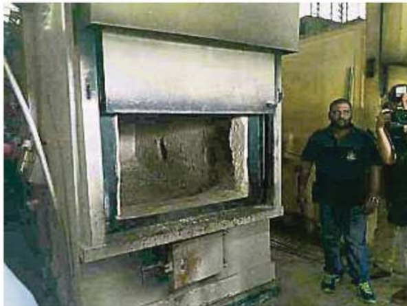
的运作。 ←巴生市议会从2004年起管理火葬场