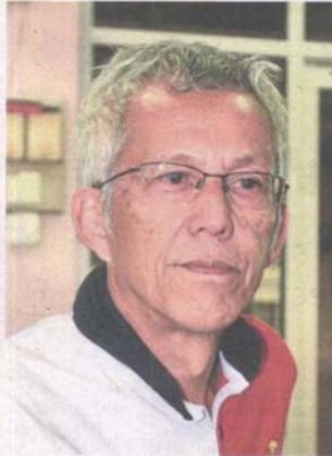
Esham says the traffic study included a traffic count at critical junctions and future traffic projection, as there are 10 existing and upcoming developments around SS7.

Rahibah said residents' feedback would be gathered and tabled at MBPJ after the trial period ends on Oct 8.